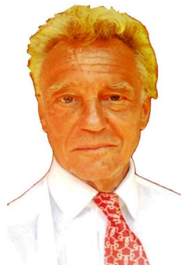
Öakom texten i den när artikeln.

Den statliga utredningen SOU 1995:95 tog upp myndigheters ofta totalitära perspektiv, att människan inte har med det att göra utan det grundas på den starkes rätt: "Det går inte att ställa upp någon gräns för vilka intrång i den personliga integriteten som den enskilde måste tåla... Registreringen av uppgifter om enskilda kommer sålunda att ske oberoende av den enskildes medverkan... Registrering skall ske oavsett den enskildes inställning härtill." Tongångar som alla despoter uttryckt, att människans åsikt inte har någon betydelse. Man påstår att vi lever i en demokrati men när politikerna inte har vetskap om utvecklingen eller kurage att stå på folkets sida då har den sista delen av demokrati gått under.